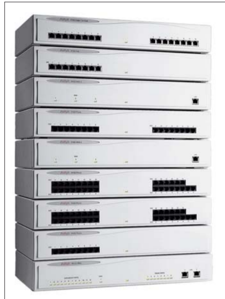
Avaya IP Office

412. Этот продукт предлагает расширенные возможности внутренней передачи данных, что позволяет использовать его в малом операторском центре или на предприятии, уделяющем основное время работе с клиентами. Модель IP412 может задействовать до 4-х линий PRI (E1/T1) и 12 модулей расширения общей ёмкостью до 256 оконечных точек и 312 линий.