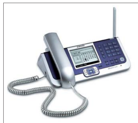
Samsung SOHO Master

Система Samsung SOHO (Small office/Home office) Master позиционируется на рынке Украины в первую очередь как решение для дома, а уж затем как офисное решение. Она объединяет в себе точку доступа беспроводной локальной сети с цифровой мини-АТС и средствами сетевого доступа через широкополосный модем — кабельный или xDSL. Устройство обеспечивает работу восьми беспроводных WLAN-те-