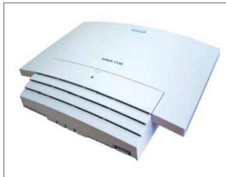
Siemens HiPath 1100

Мини-АТС Siemens HiPath 1100 V5.2 (1120/1130/1150/1190) изначально рассчитаны на малые и средние офисы с максимальным количеством внутренних портов 140 единиц. Семейство HiPath 1100 поддерживает возможность подключения как по анало-